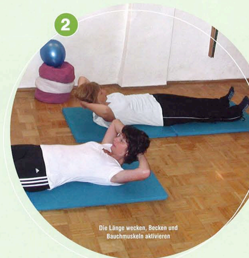
Die Länge wecken, Becken und Bauchmuskeln aktivieren