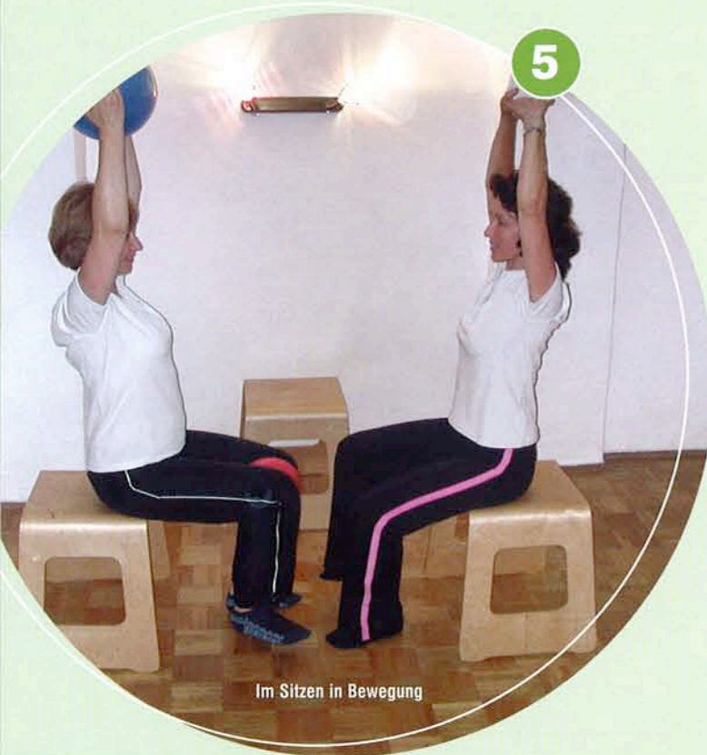
Im Sitzen in Bewegung